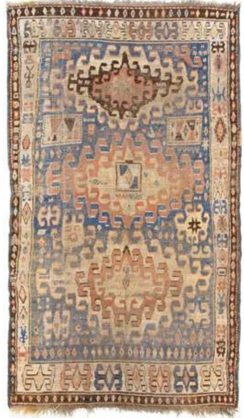
Zakatala-tapijt, Azerbeidzjan, midden 19e eeuw, wol, 300 x 175 cm (ongewoon groot formaat).

veilinghuis zich als marktleider wat betreft oude tapijten van museumkwaliteit. Elk jaar organiseert het twee veilingen, met tapijten daterend van de 15e tot het begin van de 19e eeuw. Broadhurst vertelt dat in dit marktsegment recordbedragen worden geboden. Zo werd in mei 2019 nog £ 3.895.000 geboden voor een uit het eerste kwart van de 17e eeuw daterend Safawieden-tapijt van zijde en zilverdraad, afkomstig uit Isfahan: "De kopers zijn