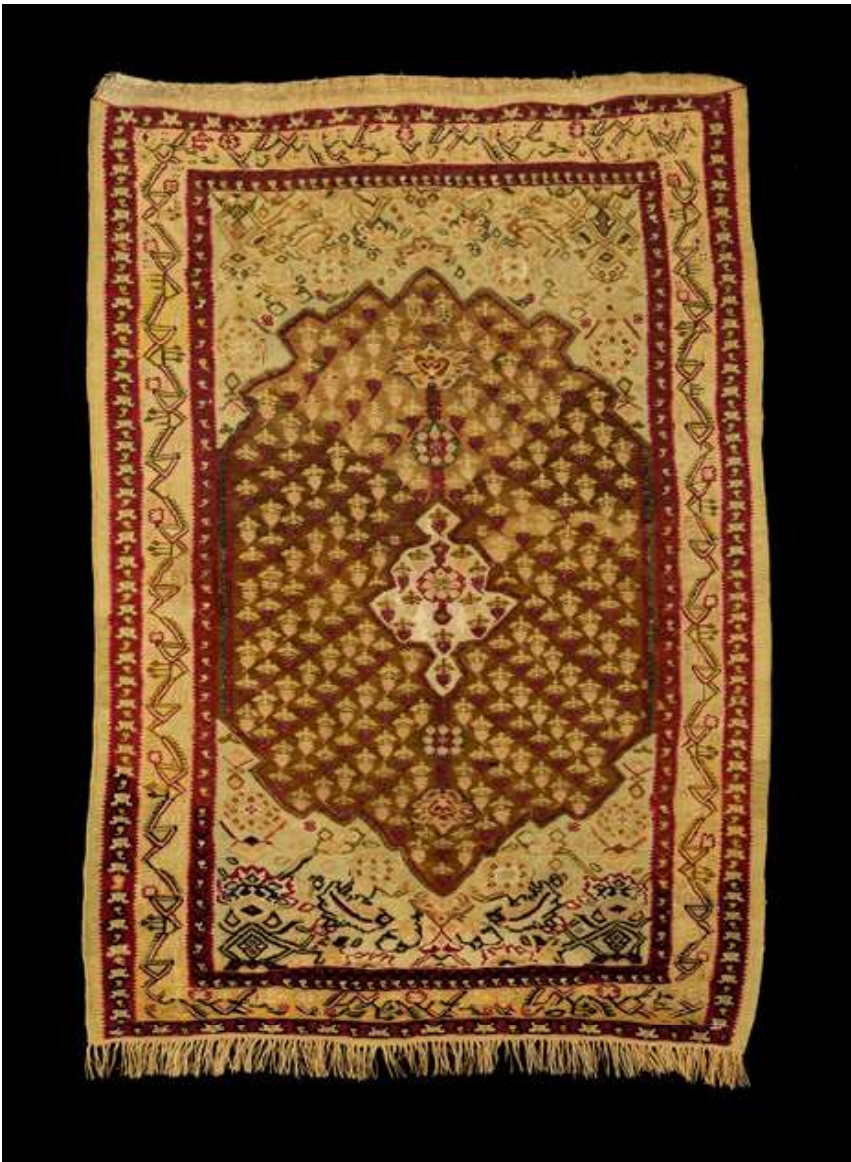
Kelim Senneh, Koerdistan, Iran, ca. 1900, zijde en zilverdraad, 57 x 80 cm.

Met hun geraffineerde patronen en prachtige kleuren geven tapijten interieurs al eeuwenlang extra cachet. Tegenwoordig gaan de oudste en zeldzaamste tapijten op veilingen van de hand voor recordbedragen. Minder oude exemplaren gaan echter veel moeilijker de deur uit. Je hebt duizend-en-een-nacht nodig om alles verteld te krijgen over de diversiteit van antieke tapijten.