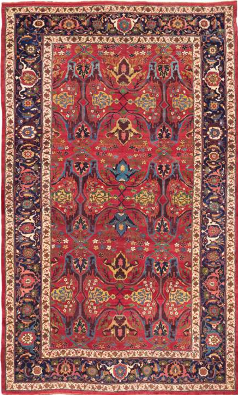
Bidjar-tapijt, Koerdistan, Iran, ca. 1880, 575 x 348 cm. Christie's, Londen, 27-04-2023. Richtprijs: € 40.000-50.000.